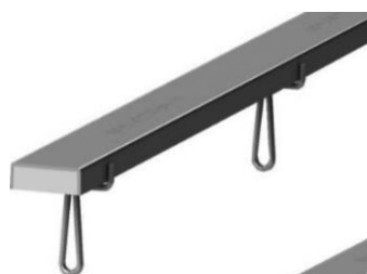
TU Tyyppi A

TU/JTB Trapetsikiskojen pituus on 3 m ja teräslevy on 3 mm kuumasinkittyä tai ruostumatonta terästä. Ruostumaton teräs on laatua EN 1.4301 (RST) tai EN 1.4571 (HST).