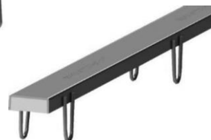
TU Tyyppi D